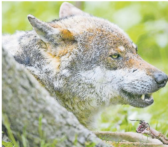
Gejagter. Standesinitiative «Wolf. Fertig lustig!» verlangt, die Wolfsjagd zu erlauben.

Der Bundesrat will im Sommer eine Revision des Jagdgesetzes vorlegen. Schon 2012 hatte der Bundesrat die Möglichkeit geschaffen, einzelne Wölfe abzuschliessen, wenn trotz Herdenschutzmassnahmen viele Nutztiere gerissen werden. Mit einer weiteren Revision der Jagdverordnung 2013 wurden die rechtlichen Grundlagen für die finanzielle Abgeltung von Herdenschutzmassnahmen geschaffen. Der Ständerat hat die Walliser Initiative letzten März klar abgelehnt.